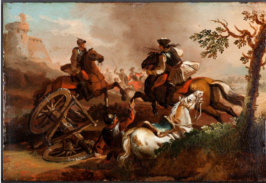
Pr646 / Ein Reitergefecht