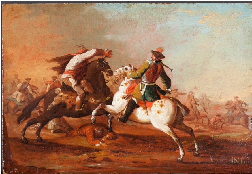
Pr647 / Ein Reitergefecht