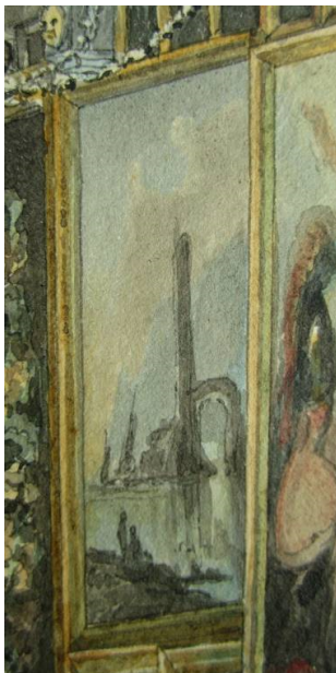
Abb. 2, Carl Morgenstern, Das Gemäldekabinett des Johann Valentin Prehn, 1829, Detail: Gemälde von Hans de Jode?, Aquarell, 30,5 x 49,5 cm, HMF, Inv. Nr. B0639