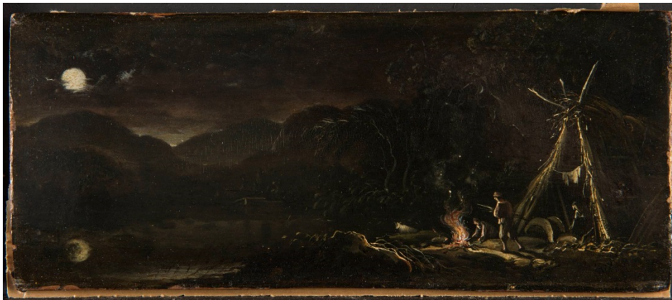
Pr294 / Strohütte mit Lagerfeuer im Mondschein, Mitte 17. Jh.