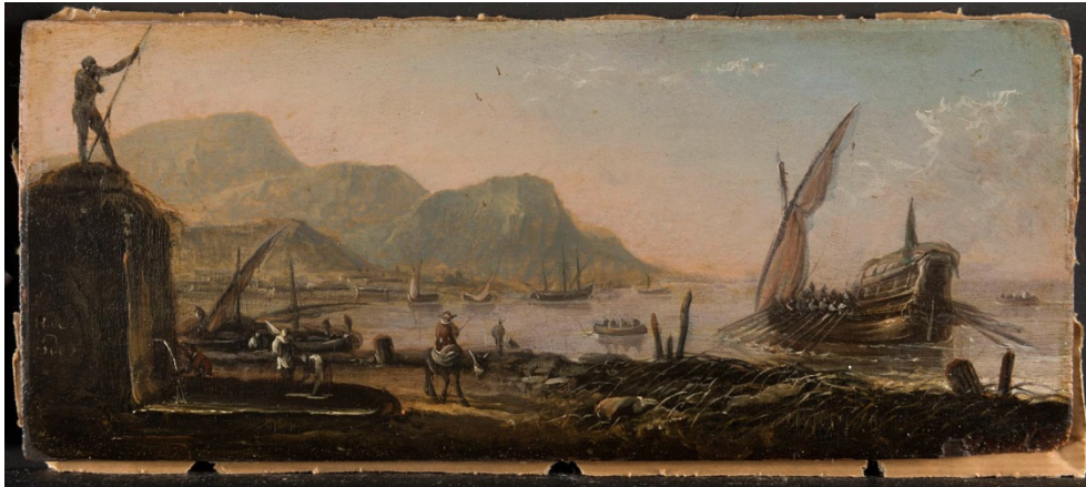
Pr293 / Südlicher Seehafen, Mitte 17. Jh.