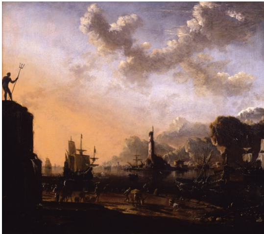
Abb. 1, Hans de Jode, Mediterraner Hafen bei Sonnenuntergang (Capriccio), ca. 1660, Leinwand, 75 x 86 cm, Andrew Blackman, Fairlight Place, Fairlight, Hastings, Sussex (Frühjahr 2016)